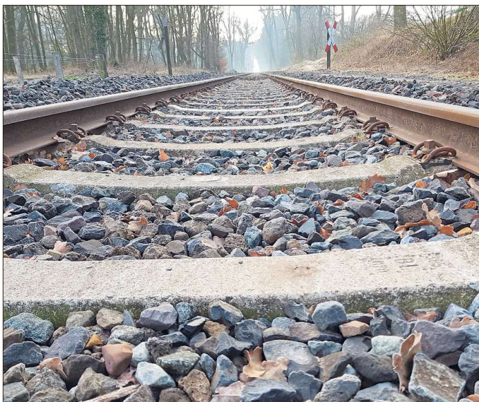
Bei dem Informationsabend zur Mobilitätsachse auf der Schiene möchte die Stadt mit interessierten Bürgern ins Gespräch kommen. An Thementischen soll mit den Beteiligten über die Haltepunkte Harsewinkel und Marienfeld sowie über Technik und Betrieb der Strecke gesprochen werden.